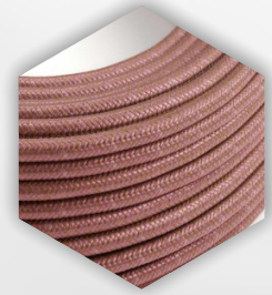
Καλωδιώσεις των strings