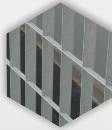
Μεταλλικά κικκλιδώματα τύπου ASCO